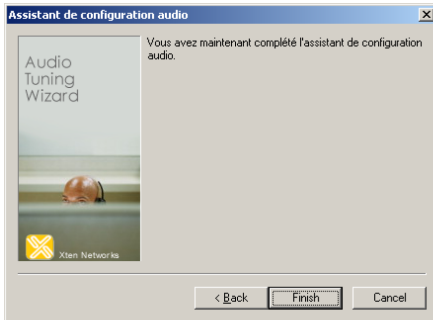
Figure 3 – Terminer la procédure de Configuration Audio