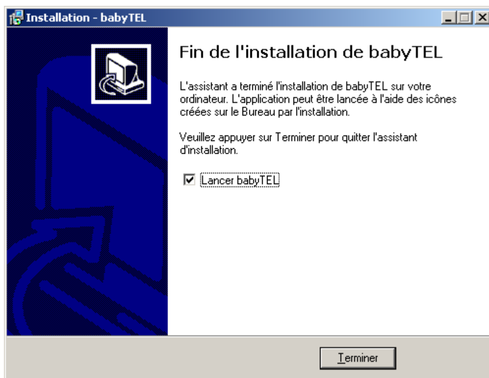
Figure 1 – Compléter l'installation du téléphone logiciel

Une fois le fichier téléchargé, double cliquez dessus pour lancer l'installateur et suivez les instructions à l'écran. Lorsque vous verrez la fenêtre montrée ci-dessous, choisissez «Lancer babyTEL» et cliquez sur Finish .