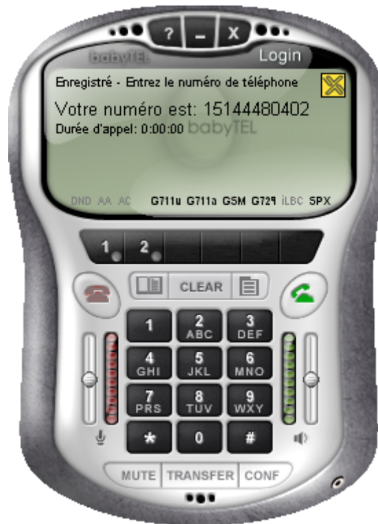
Figure 5 – La fenêtre du téléphone logiciel de babyTEL

Vous devriez maintenant être connecté au service babyTEL et prêt à faire ou recevoir des appels. L'affichage devrait ressembler à ceci :