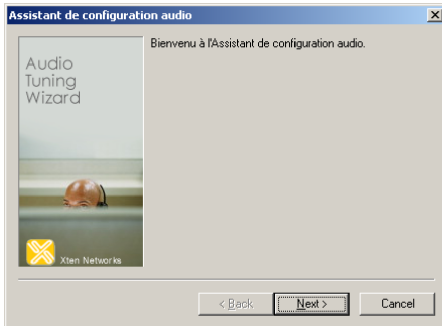
Figure 2 – Lancer l'Assistant de Configuration Audio

Note: Il est recommandé de compléter cette procédure avant de poursuivre. Si vous choisissez d'attendre, vous pourrez le faire plus tard en cliquant dans la fenêtre principale avec le bouton droit et en sélectionnant l'Assistant de Configuration Audio.